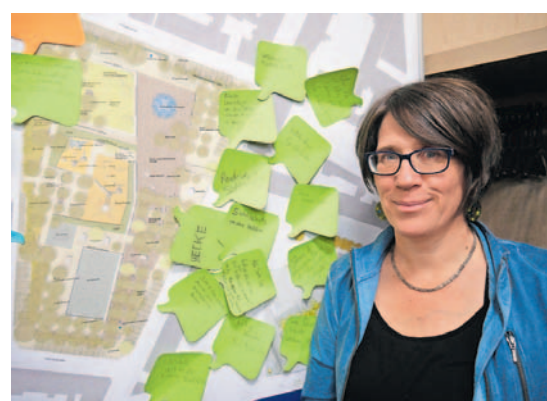
Von Landschaftsarchitektin Stephanie Hackl stammt der Entwurf für den neuen Jannitzerplatz.

Ideen, die bis zum 14. April auch wieder via Internet über www.onlinebeteiligung.nuernberg.de abgegeben können, ausgewertet und in den Entwurf eingearbeitet. Im April soll noch