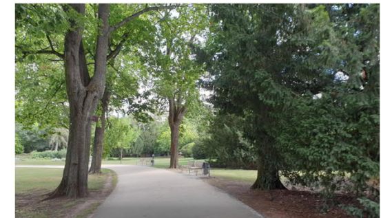
Beispiel: Neue Wegeführung und neuer Belag im Bereich Rosenhügel