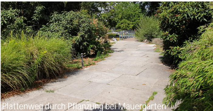
Plattenweg durch Pflanzung bei Mauergärten

Belag: Anbindungen an Hauptweg Asphalt, ansonsten wassergebundene Wegedecke