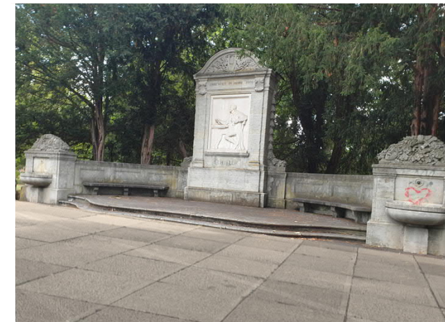
Beispiel Neugestaltung kleiner Platz am Schillerdenkmal