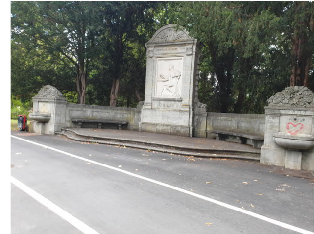
Bestand Schillerdenkmal: gefährliche Wegeführung und unpassende Gestaltung